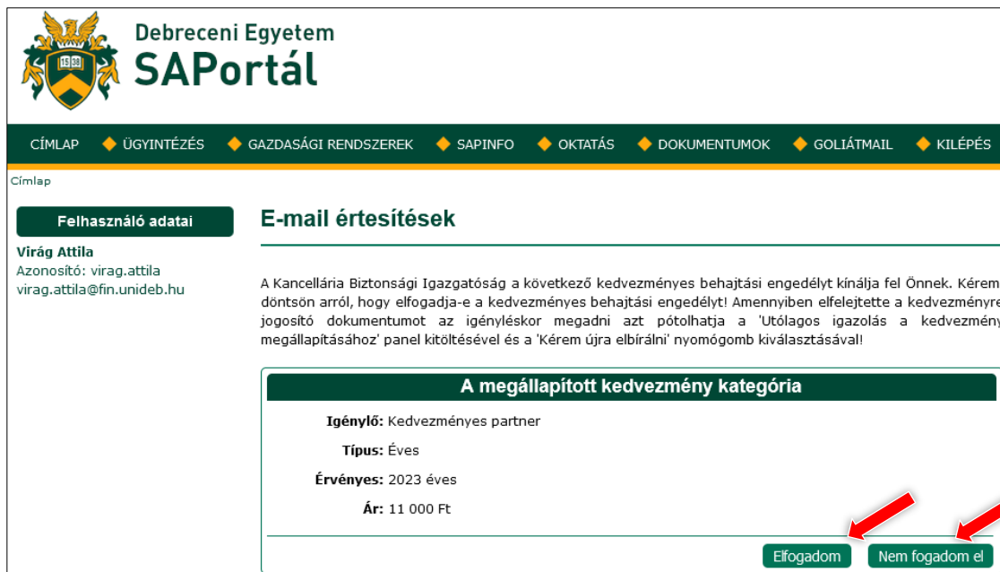
12. ábra: Kedvezmény elfogadása/elutasítása

Amennyiben elutasítja azt, az igénylése lezárul.