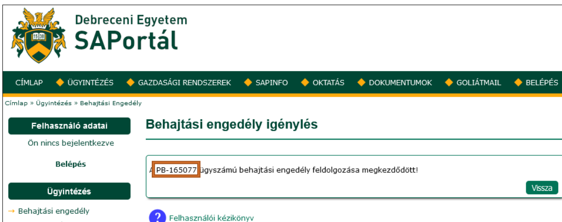
11. ábra: Igénylés ügyszáma

A képernyőn megjelenik az igénylés ügyszáma, melyet a rendszer az igénylő e-mail címére egy tájékoztató levél formájában is elküld.